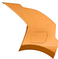
Oranžová Tangerine (TGT)