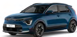
Modrá Mineral (M4B)