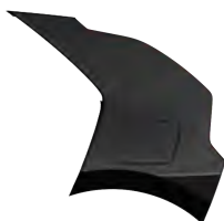
Perleťová Černá Aurora (ABP)