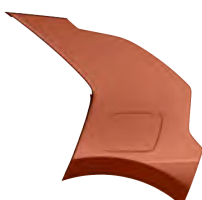
Oranžová Delight (DRG)