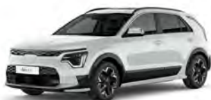
Perleťová Bílá Snow (SWP)