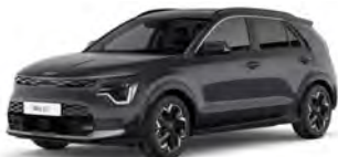
Šedá Interstellar (AGT)