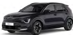
Perleťová Černá Aurora (ABP)