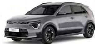
Šedá Steel (KLG)