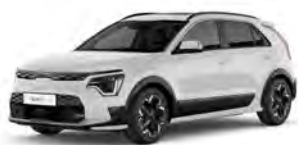
Bílá Clear (UD)