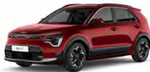
Červená Runway (CR5)