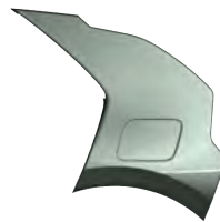
Zelená Cityscape (CGE)