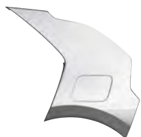
Šedá Interstellar (AGT)