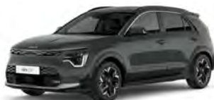
Zelená Cityscape (CGE)