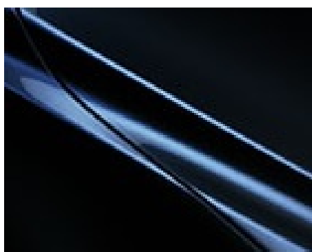
DEEP CRYSTAL BLUE