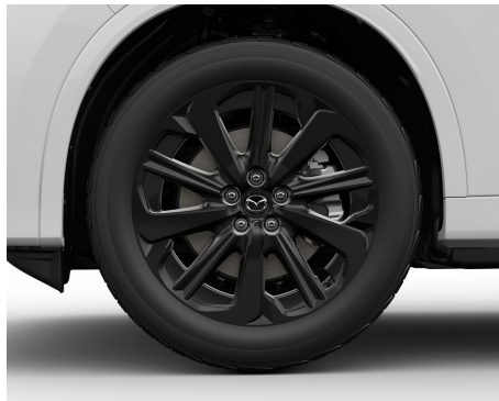
20 KOLA Z LEHKÉ SLITINY, ČERNÁ / 235/50R20_100W