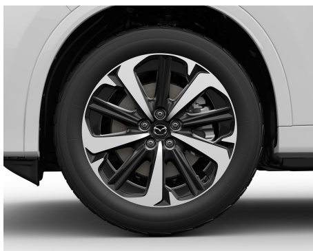
20 KOLA Z LEHKÉ SLITINY, ČERNÁ / 235/50R20_100W