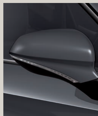
GRAPHENE ŠEDÁ FR