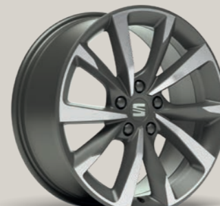
PERFORMANCE II 18" FR