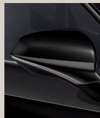
MIDNIGHT ČERNÁ St FR

Style St FR FR Standardní výbava ■ Výbava na přání ■