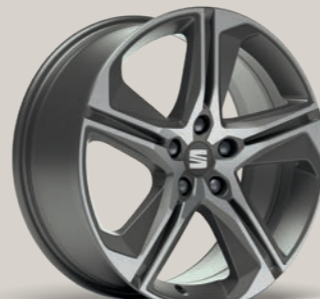
SPORT 18" FR