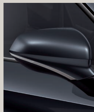
MAGNETIC ŠEDÁ St FR