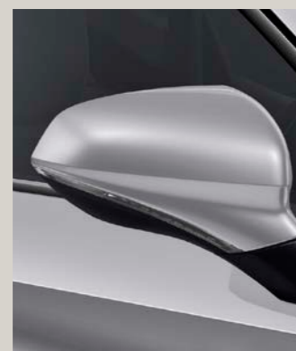
URBAN STŘÍBRNÁ St FR