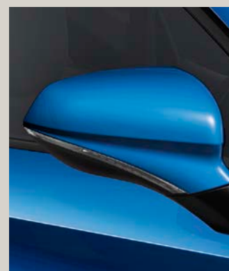
SAPPHIRE MODRÁ St FR