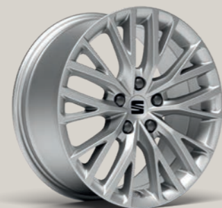
DYNAMIC I 17" St