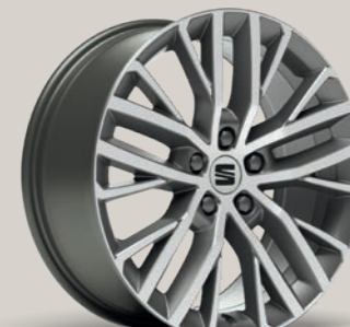
PERFORMANCE I 18" FR