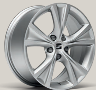
DYNAMIC III 17" FR