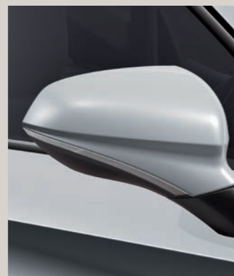
NEVADA BÍLÁ FR