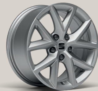
DESIGN 16" St